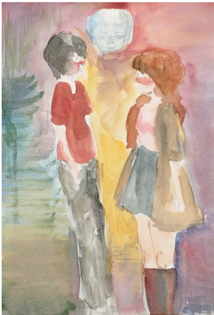
Рисунок В. Кудрицкой, 9В

Такая вот несвобода выбора. (автор пожелал остаться неизвестным)