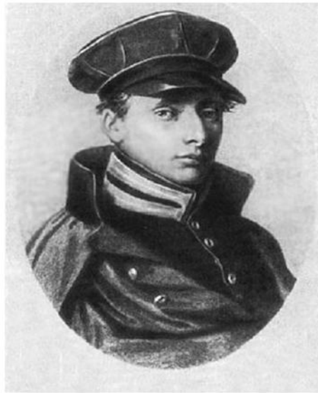
22 ноября – День Рождения В.И. Даля. Владимир Даль -